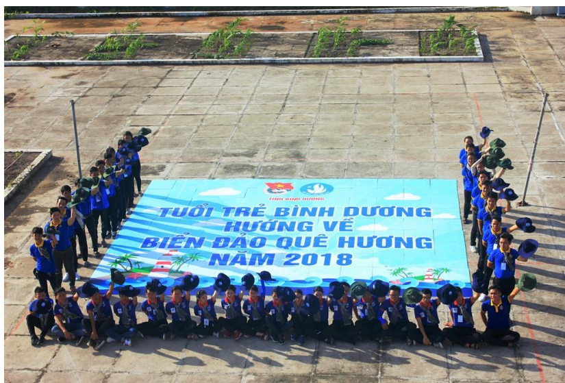
Xếp hình "Tuổi trẻ Bình Dương hướng về biển đảo quê hương"